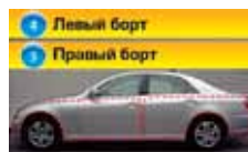
4 Левый борт